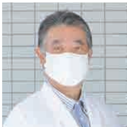
緩和ケア学会所属 平成31年1月より、南野病院に勤務。